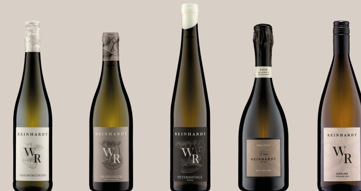
GUTSWEIN ORTSWEIN LAGENWEIN SEKT BASIS