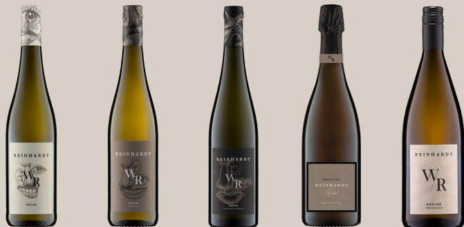
GUTSWEIN ORTSWEIN LAGENWEIN SEKT BASIS